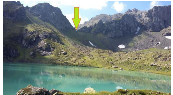
The pass south of Didi Okrostsikhali Lake is marked by the arrow.

ეს უღელტეხილი ერთმანეთთან სვანეთს და ოკუპირებულ აფხაზეთს აკავშირებს. შესაბამისად, როდესაც უღელტეხილზე ავალთ, მეორე მხარეს ოკუპირებული ტერიტორიის ხედი გადაგვემდება.