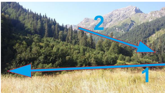
1 — მდინარე ორმელეთის მიმართულება 2 — მდინარე ოქროსწყლის მიმართულება

მინდორზე მდინარე ოქროსწყლის ხეობა ჩვენი მოძრაობის მიმართულებიდან მარცხნივ გამოჩნდება. შესაბამისად, მდინარე ოქროსწყალი მდინარე ორმელეთის მარჯვენა შენაკადია. მდინარე ოქროსწყალი დიდი ოქროსწყლის ტბიდან გამოედინება.