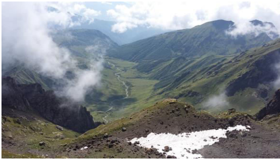
აფხაზეთის ტერიტორიის ხედი ულელტეხილიდან

არ დაეშვათ აფხაზეთის მხარეს! საქართველოს მოქალაქეებისთვის ეს კანონიერია, მაგრამ სახიფათო, ხოლო უცხოელებისთვის — უკანონო და სახიფათო. არსებობს რუსული საოკუპაციო ძალების ან მათ მიერ მხარდაჭერილი სეპარატისტული ხელისუფლების წარმომადგენლების მიერ უკანონო დაკავების საფრთხე.