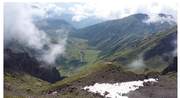
View of the territory of Abkhazia from the pass

This is the pass connecting Svaneti and occupied Abkhazia. So, once we reach the pass, we see the views on occupied territory on the opposite side.