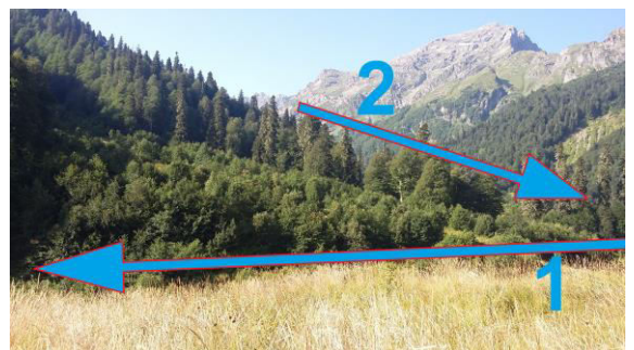
1 — Ormeleti River stream 2 — Okrostskhali River stream

On the field, the valley of Okrostskhali River will appear left of our moving direction. It means that Okrostskhali River is a right tributary of Ormeleti River. Okrostskhali River flows out from Didi Okrostskhali Lake.