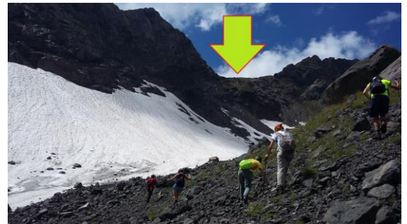
The glacier and the pass (marked by the arrow)

We DO NOT descend to the valley! Our way lies to the right, along the glacier, to the pass.