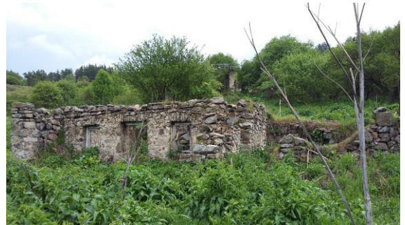
Abandoned luri village

After certain distance, we'll meet some forest road that leads us to the abandoned village of luri.